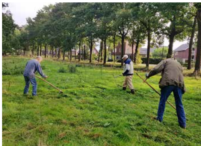
Aan de slag tijdens een zeiscursus

je zaaiden we een strook in met soorten als teunisbloem, kaasjeskruid, wilde peen, heelblaadjes en boerenwormkruid. Hier kunnen de schapen niet bij. De haag zorgt voor beschutting en warmte, goed voor insecten en vlinders. Een lage grondwal met hondsroos, meidoorn, hazelaar en liguster, zorgt voor een barrière met de naastgelegen hondenuitlaatwei. Het middelste landje is onderdeel geworden van een proefproject voor natuurlijke bestrijding van de eikenprocessierups. Het is recent ingezaaid met een zaadmengsel met soorten waar vijanden van de eikenprocessierups op afkomen. Naast soorten zoals rode klaver, pastinaak en gewone berenklauw verwachten we ook gewoon barbakruid, duizendblad, klein streepzaad, gele morgenster, fluitenkruid, kleine ratelaar en boerenwormkruid. Omdat insecten en vlinders overwinteringsplek nodig hebben, zijn er extra boomstammen en een takkenhoop neergelegd. Verder zijn er nestkasten opgehangen voor mezen, die graag eikenprocessierupsen eten. Het achterste landje is omgeven door eiken en beuken. Het is scha-