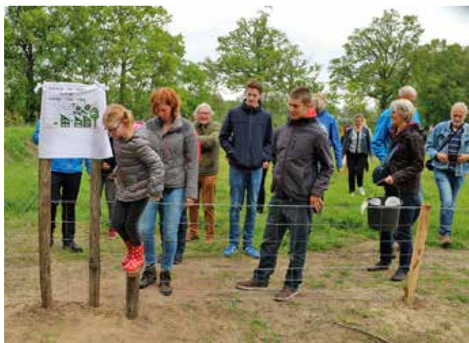
Buurtbewoners tijdens de opening