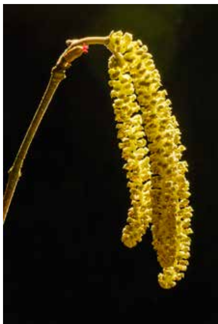
Bloeiende hazelaar